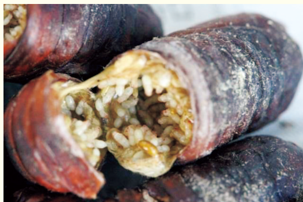
図1. ウスタビガの蛹に寄生したコバチの幼虫

寄生バチの被害が大きかった年が一度ありました。ウスタビガの蛹に寄生する小型の寄生バチです(図1)。7月にアリにやられているウスタビガを見つけたのですが、実はそれがアリではなく小さな寄生バチだったのです。すでにいくつかのウスタビガの蛹に寄生しており、外見では分からなかったため、収繭して蚕室においていました。8月のある日、窓に小バエのようなものが多くとまっていたので変だなと思いました。ウスタビガのケース内に同じ虫がおびたしくいるのを見つけ、ようやく寄生バチと